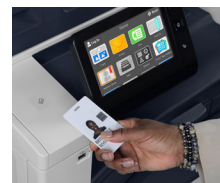
Pozice pro čtečku karet s integrovaným portem USB. 3

Standardní zásobník 1 na 520 listů 2 podporuje média o velikosti 139,7 x 182 mm až 297 x 431,8 mm.